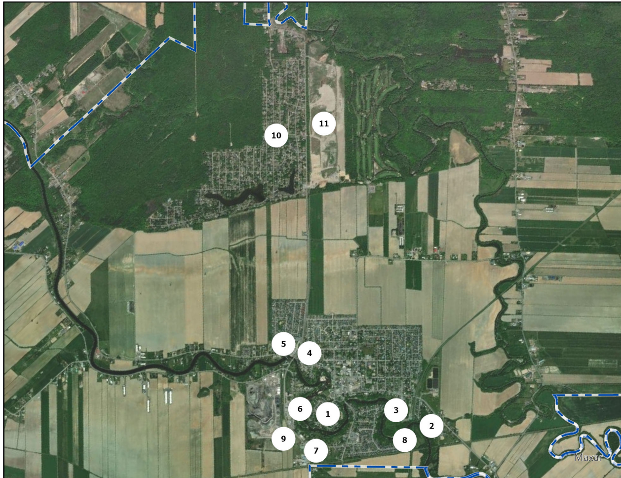
Carte 2. Localisation des secteurs de développement de la ville de L'Épiphanie.

eaux usées autonome à même le site de la sablière Allard, ce qui, ultimement, nécessitera une demande pour la création d'un nouveau périmètre d'urbanisation.